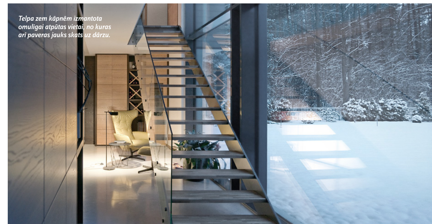
Telpa zem kāpnēm izmantota omulīgai atpūtas vietai, no kuras arī pavaras jauks skats uz dārzu.